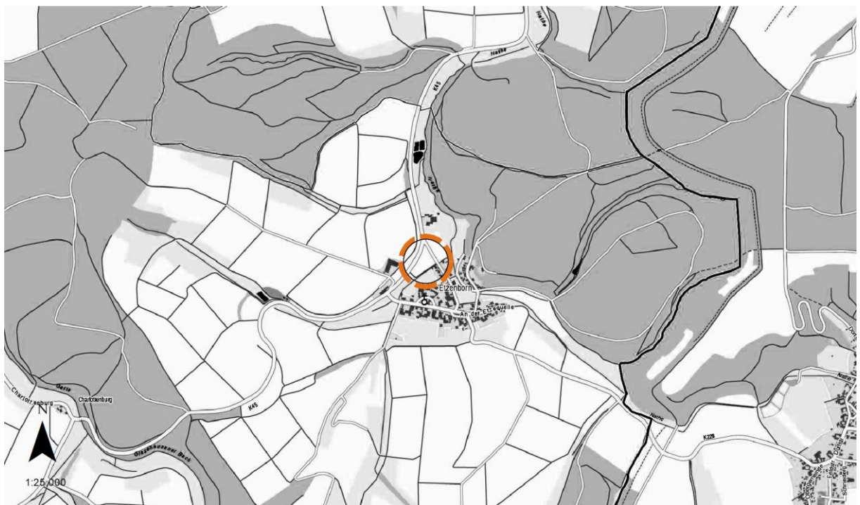
Übersichtskarte, Lage der FNP-Änderung, Maßstab 1:25.000

(Kartengrundlage: Amtliche Karte 1:5.000 (AK5), Quelle: Auszug aus den Geobasisdaten der Niedersächsischen Vermessungs- und Katasterverwaltung 2020.)