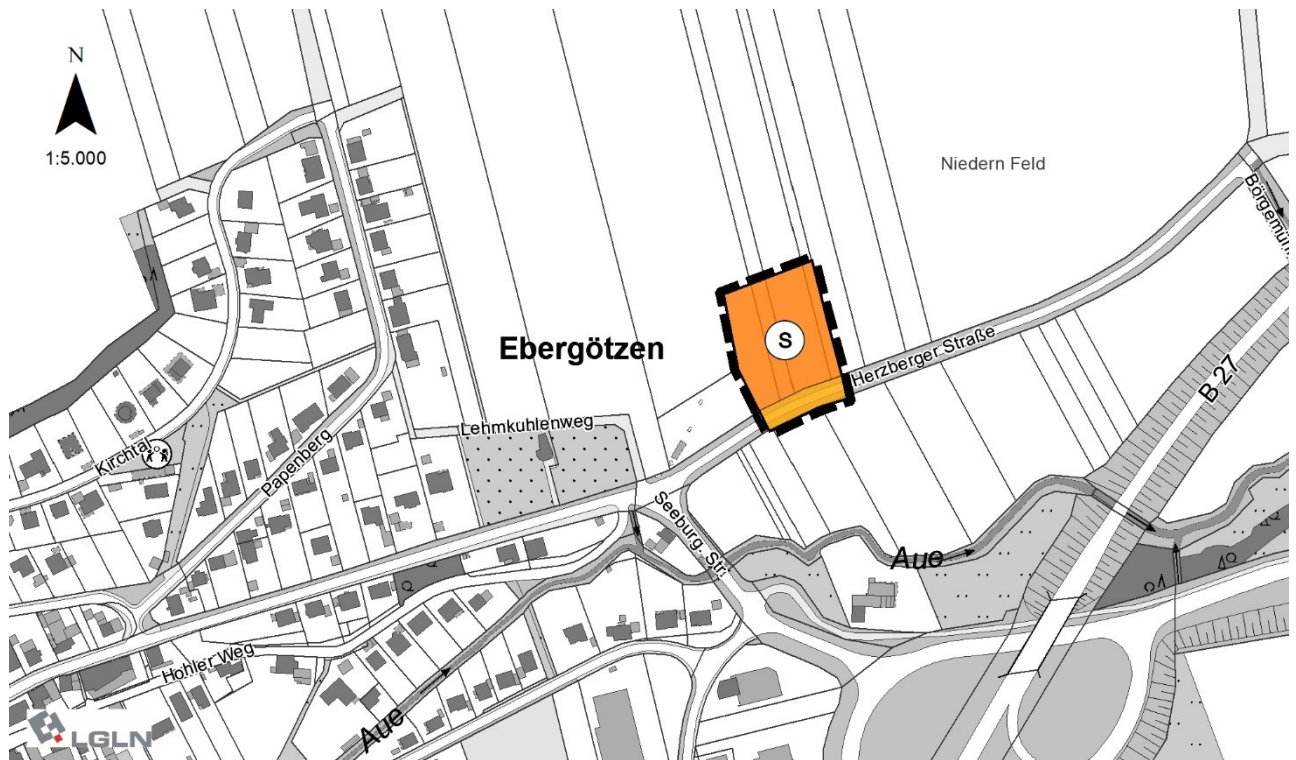
Abbildung: Berichtigung des Flächennutzungsplanes der Samtgemeinde Radolfshausen Maßstab 1:5.000